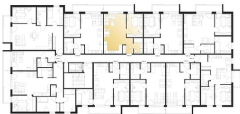
RZUT 2 PIĘTRA

BUDYNEK: MW1 KONDYGNACJA: 2 PIĘTRO NUMER LOKALU: 20